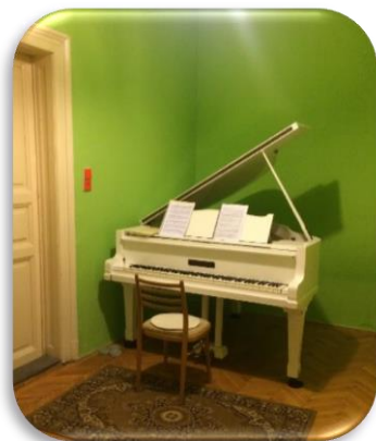
アパートのピアノ