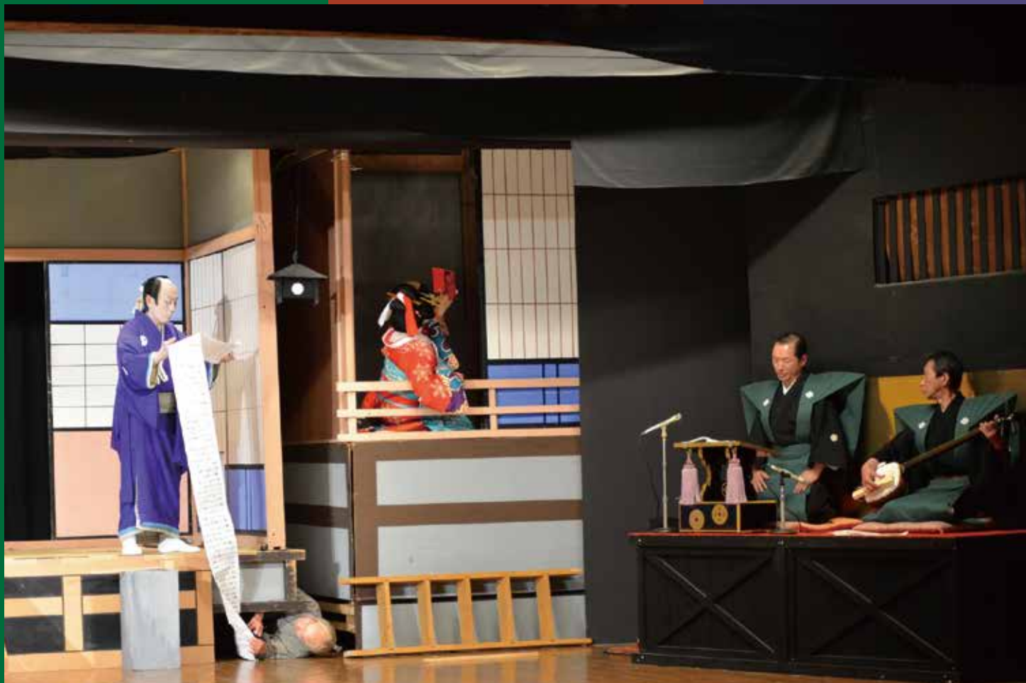
鳳凰座 歌舞伎公演「一力茶屋」